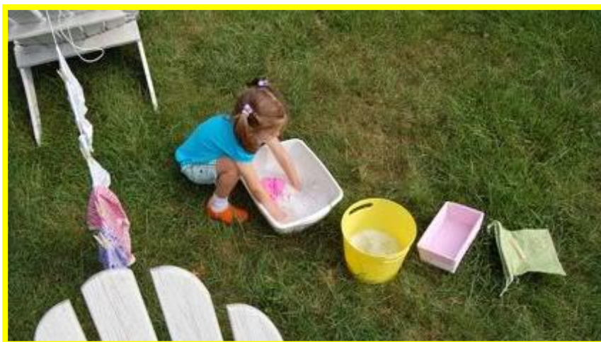
R  rence photo : Pinterest